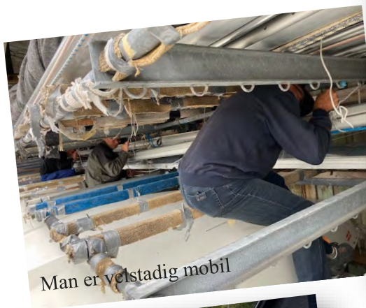
Man er velstædig mobil