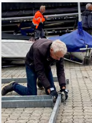
Knap var pladsen ryddet før der var gang i opsætning af bådstativer for Vinteropbevaring!!