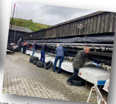
Pladsen er ryddet for joller og endog Liberte's mast kom i hus. Dejligt når så mange hjælper til. Tak for det.