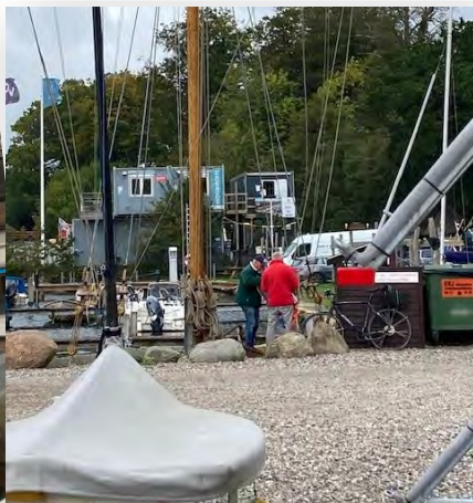
Flagspillet ryddet for gæste-flag. Formand og flagansvarlig i aktion